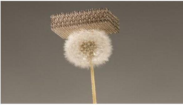
Document 2 : Photo de Micro-lattice